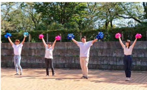
上：見本ポーズ用写真撮影