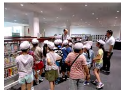
日野市小学校大学見学の様子