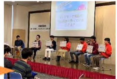
多摩地区 5 大学合同ボランティア活動報告イベントの様子