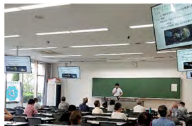
第4回(10/5) 宇宙システム入門 ～ロケットから小型衛星まで～ 講師：電気電子工学系 宮村 典秀 准教授