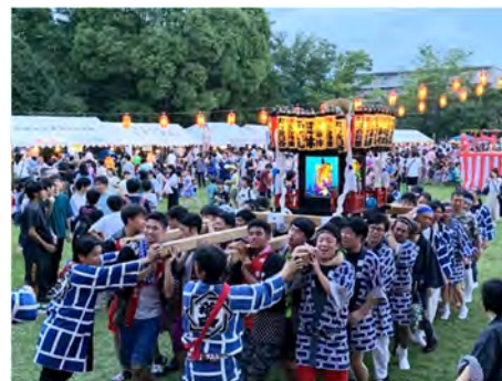
本学硬式野球部は「落合ふるさと夏祭り」(多摩市)に例年参加しています。

明星大学では2015年に地域交流センターを開設し、地域交流活動を推進しています。これまでに日野市・青梅市・八王子市およびあきる野市と包括連携協定を締結し、地域の抱える問題解決に向けた協働、生涯教育の推進、人的および知的資源の提供を進めています。