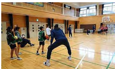
東久留米市立第一小学校 (12/19)