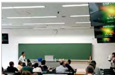
第1回(9/14) チリも積もれば、赤外線で見える宇宙 講師：物理学系 尾中 敬 常勤教授

明星大学理工学部総合理工学科の講師陣が各人の専門分野で、宇宙や気象についての講義を行いました。