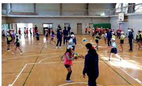
調布市立北ノ台小学校 (2/10)